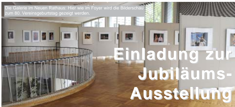
Die Galerie im Neuen Rathaus: Hier wie im Foyer wird die Bilderschau zum 80. Vereinsgeburtstag gezeigt werden.