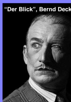
"Der Blick", Bernd Deck