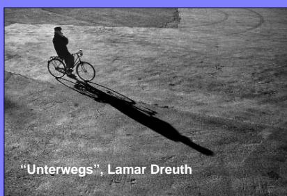
"Unterwegs", Lamar Dreuth