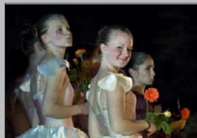
Von Bernd Deck: 149 Punkte