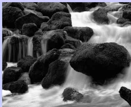
Bildbeispiel zum Vortrag “SW-Druck”

17.12.09, 20.00 Uhr: Stammtisch, Gaststätte “Zum Kirschenwäldchen”