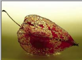
Von Jürgen Mootz: 150 Punkte