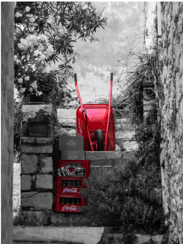
2. Platz: Ulrich KERN (oben links)