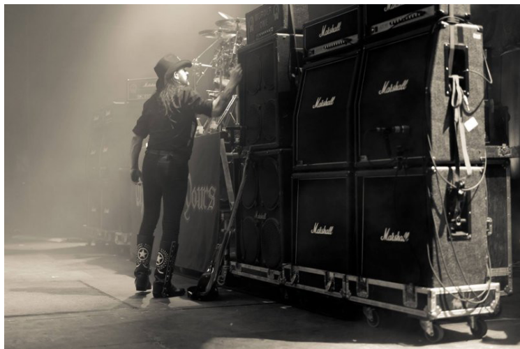
Motörhead