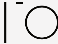
Bild des Monats April - Tierportrait: