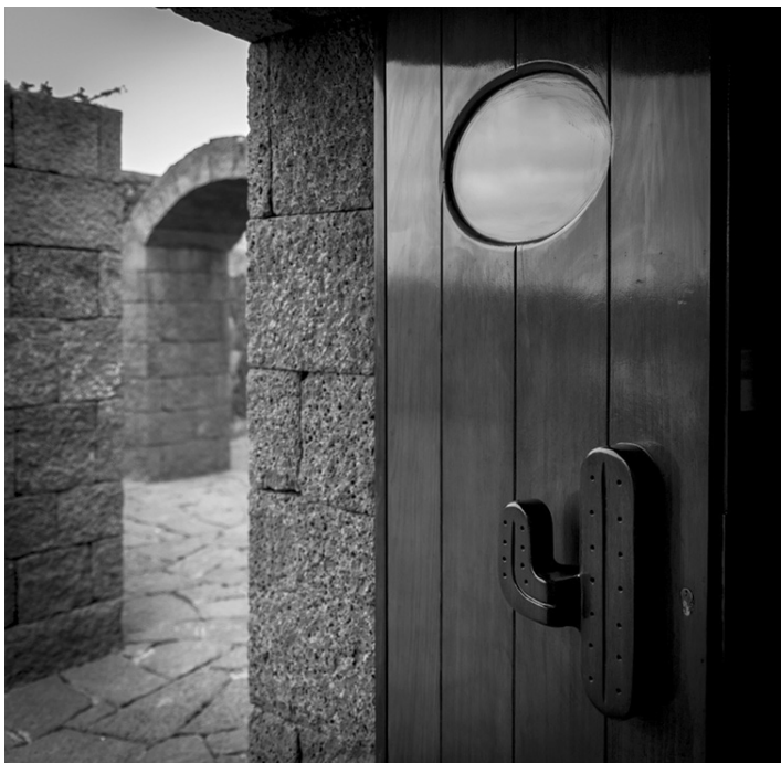
Platz 4: Mario LANGLITZ