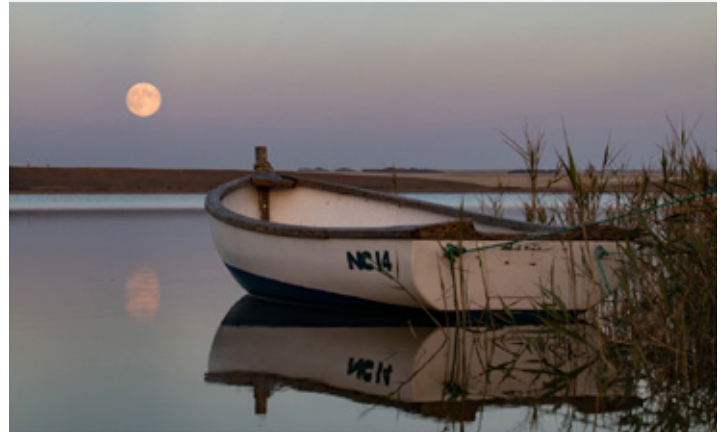
Platz 2: Michel SCHWARZER