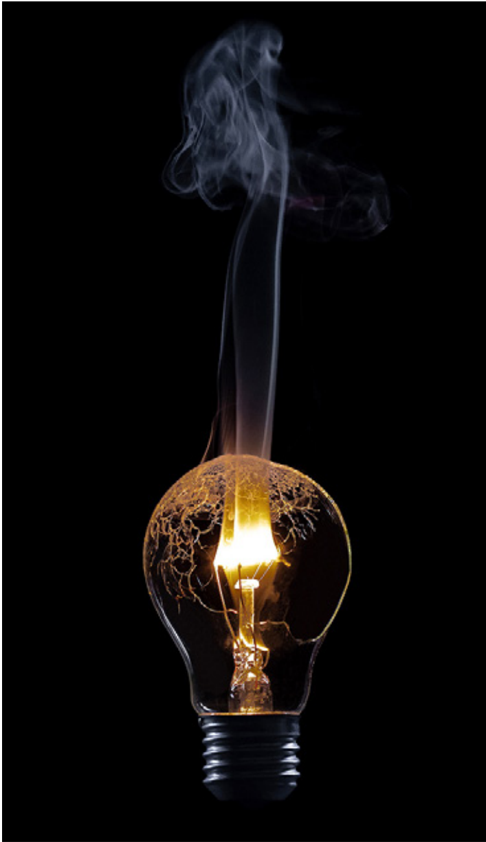
Platz 2: Michel SCHWARZER