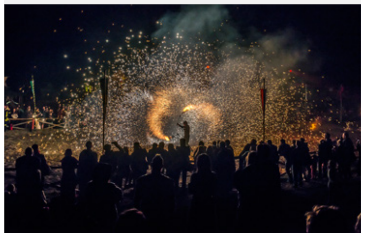
Platz 5: Lamar DREUTH