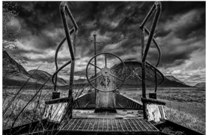
Platz 4: Norbert BLAHA