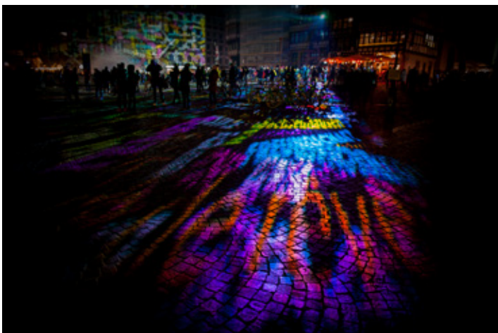
Platz 5: Mario LANGLITZ