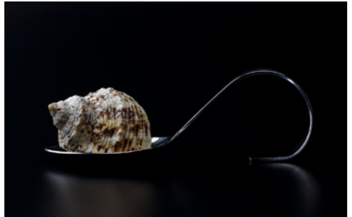
Platz 2: Matthias DILDEY (links oben),