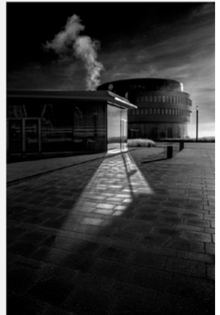
Platz 5: Lamar DREUTH (rechts unten)