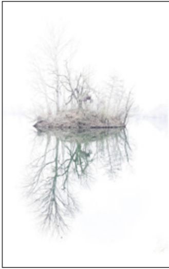
Platz 2 und 3: Claudia SCHMIDT (links und rechts oben), Platz 4: Thomas NEEB (unten Mitte), Platz 5: Burkhard KLEIN (unten rechts)