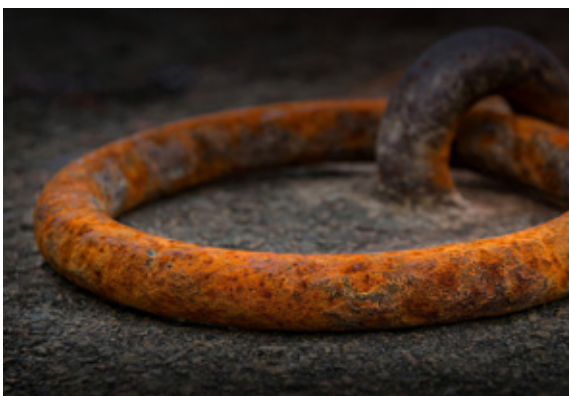
Platz 2: Gerhard PFEIFER (oben links), Platz 3: Wolfgang RENTZSCH (oben mitte), Platz 4: Wolf-Ekkehard KESSLER (oben rechts) und Richard WALZ (unten rechts), Platz 5: Lamar DREUTH (unten links)