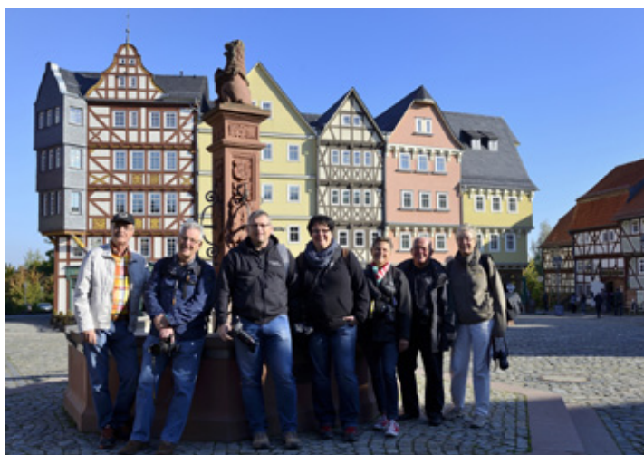
Foto-Ausflug in den Hessenpark

Daß der Hessenpark in Neu-Anspach auch unter fotografischen Aspekten immer einen Besuch wert ist, davon überzeugte sich eine Gruppe von FotoFreunden Anfang Oktober.