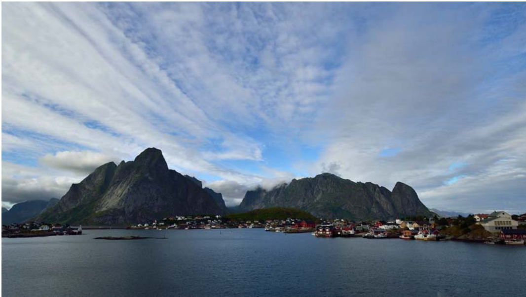
Platz 3 belegten zusammen: MANFRED JUNG (LINKS) UND LAMAR DREUTH (MITTE LINKS)

Einsendeschluß für das BdM September ist der 9. September 2014 (Thema "Ochsenfest").