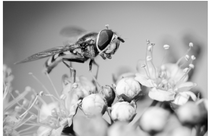
Platz 4: ANETTE HOFFMANN (MITTE RECHTS) , Platz 5: BURKHARD KLEIN (UNTEN LINKS) UND RICHARD WALZ (UNTEN RECHTS)