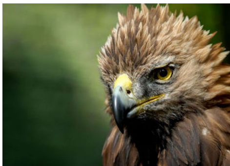
Platz 4 (Walter SCHWAB)