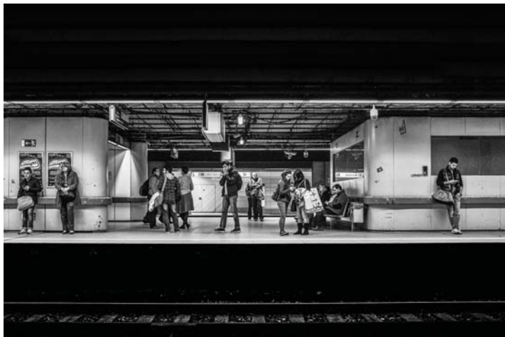
Platz 1: BERND DECK (OBEN), Platz 2: BURKHARD KLEIN (UNTEN)

Die "Bild-des-Monats-April"-Konkurrenz hat eine Momentaufnahme aus dem Frankfurter Untergrund (U-Bahn-Hof Hauptwache) gewonnen. Bernd Deck hat es aufgenommen. Die bestplatzierten fünf Bilder sind wie immer auf unserer "Galerie"-Seite einsehbar. Einreichungen für den Monatswettbewerb Mai,