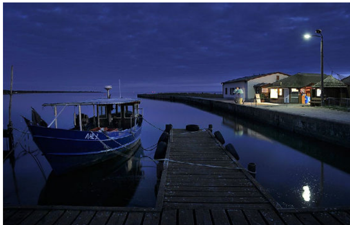
Platz 1: Lamar DREUTH (90 Punkte) – Herzlichen Glückwunsch!

Abendstimmung in einem kleinen Hafen, ausdrucksstark und gefühlvoll aufgenommen von Lamar DREUTH – das ist das Siegerbild unserer »Bild des Monats«-Konkurrenz November. Die Bilder der ersten fünf Plätze gibt es wie immer in unserer Galerie unter www.fotofreunde-wetzlar.de zu sehen.