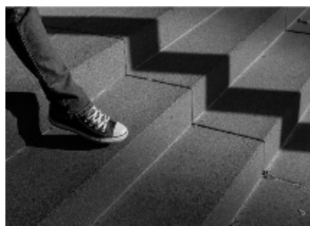
Platz 1: Richard WALZ (84 Punkte, oben links) Platz 2: Burkhard KLEIN (83 Punkte, oben rechts) Platz 3 mit jeweils 81 Punkten: Joachim FREWERT (unten links) und Oliver ZIELBERG (unten rechts).