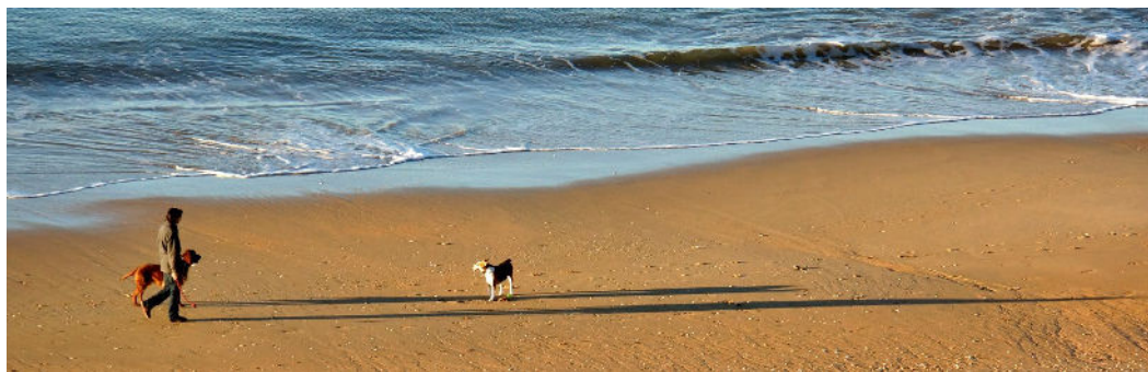
2 x Platz 3 (95 Punkte): Die Bilder von Dieter DAUSER (oben) und Joachim FREWERT (rechts)