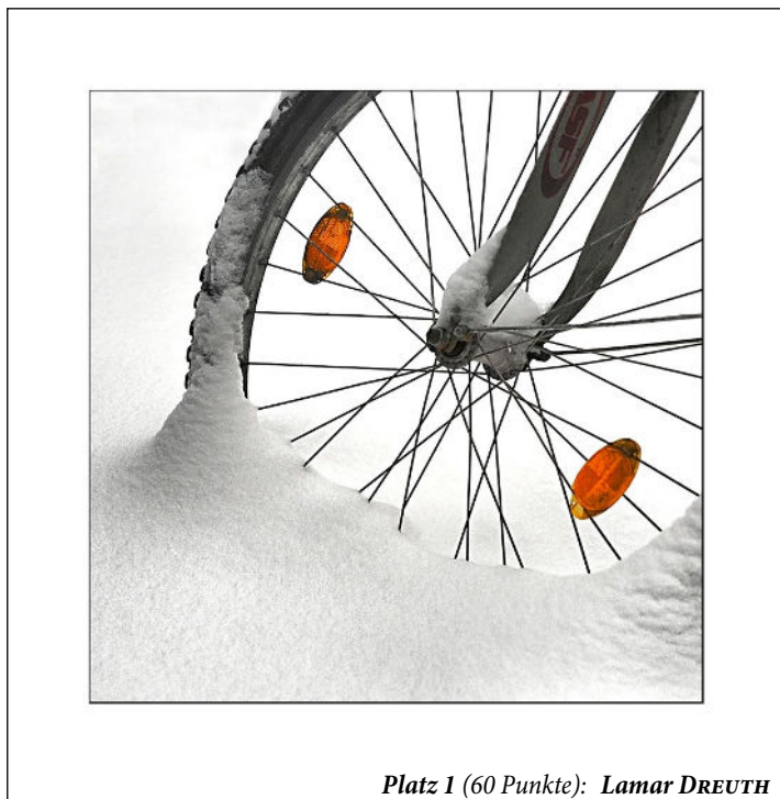
Platz 1 (60 Punkte): Lamar DREUTH