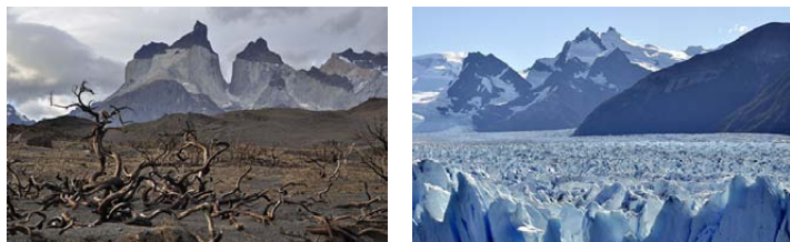
Die Bilder von Richard WALZ hängen noch bis Ende Oktober (Forsthausstr. 3)