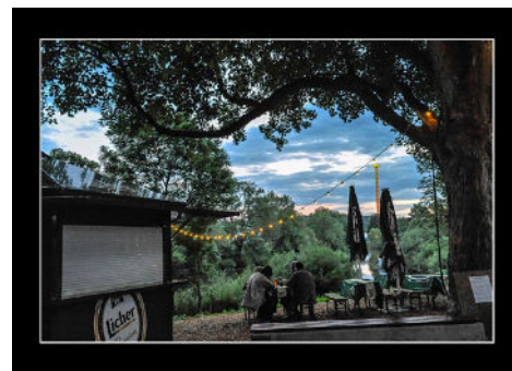
Platz 3: Bernd DECK (55 Punkte)