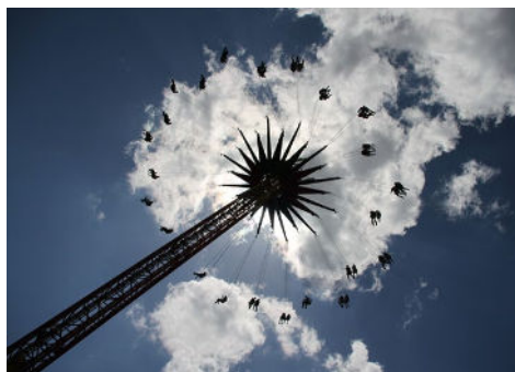
Platz 3: Karin HEBISCH-HOYER (55 Punkte)