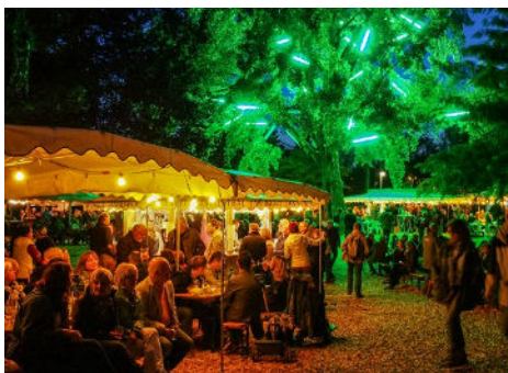
Platz 3: Burkhard KLEIN (55 Punkte)