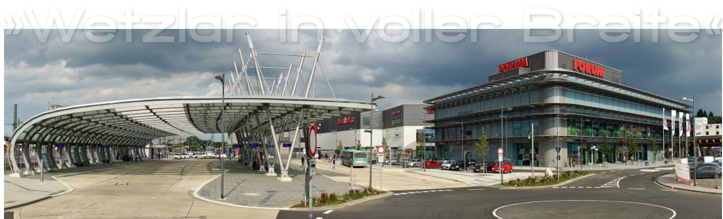
Mit einer Breite von 2,26m und einer Höhe von 60 cm das größte Panorama der Ausstellung: Der neue Busbahnhof und das Forum