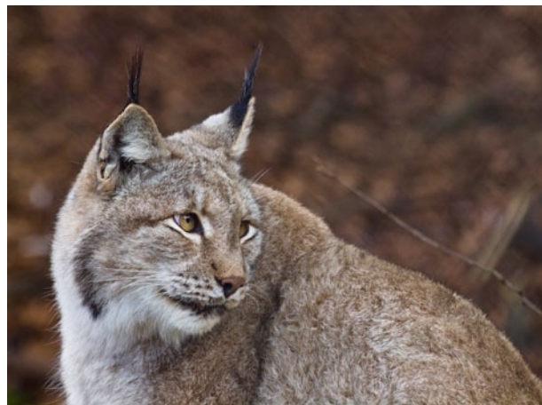
Platz 5: Burkhard KLEIN (101 Punkte)