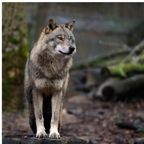
Platz 4: Wolf-Ekkehard KESSLER (109 Punkte)