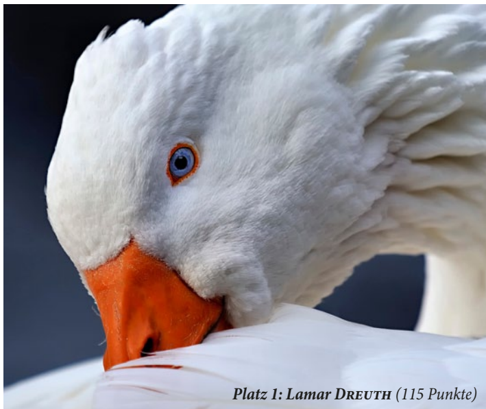
Platz 1: Lamar DREUTH (115 Punkte)

Den Farbtupfer des Bildes perfekt nach der Drittelregel plaziert, das Hauptmotiv knackig scharf – insbesondere das blaue Auge, das den Betrachter geradezu fixiert –, das gesamte Gefieder perfekt durchgezeichnet und der Hintergrund völlig unscharf und in tollem Farbkontrast zum Rest des Bildes: Mit seinem Bild einer Gans aus dem Wildpark Weilburg entschied Lamar DREUTH den »Bild des Monats«-Wettbewerb im Januar 2012 klar für sich. Die Bilder der Plätze 2 bis 5 finden Sie umseitig. Den Fotografen einen herzlichen Glückwunsch zu den gelungenen Bildern!