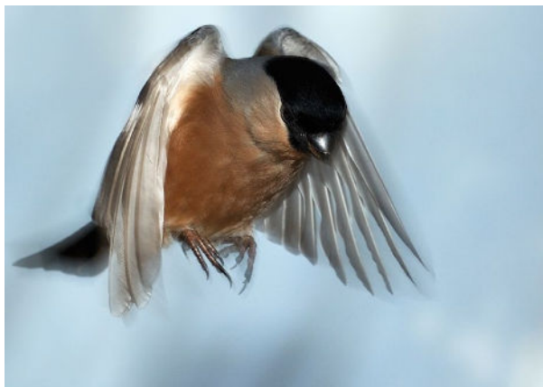
Platz 5: Wolf-Ekkehard KESSLER (81 Punkte)