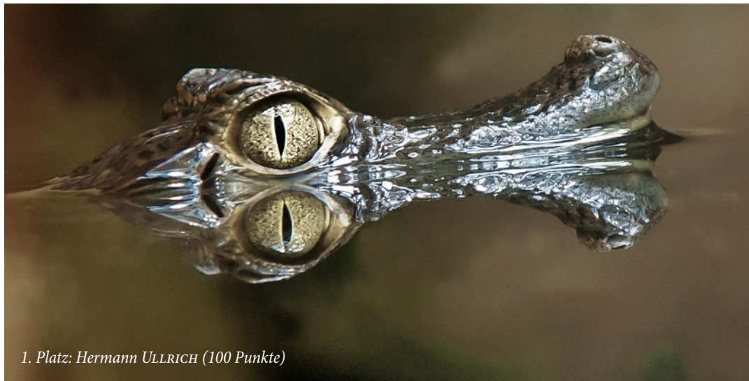
1. Platz: Hermann ULLRICH (100 Punkte)