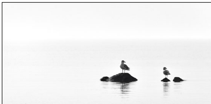
2. Platz: Lamar DREUTH (78 Punkte)