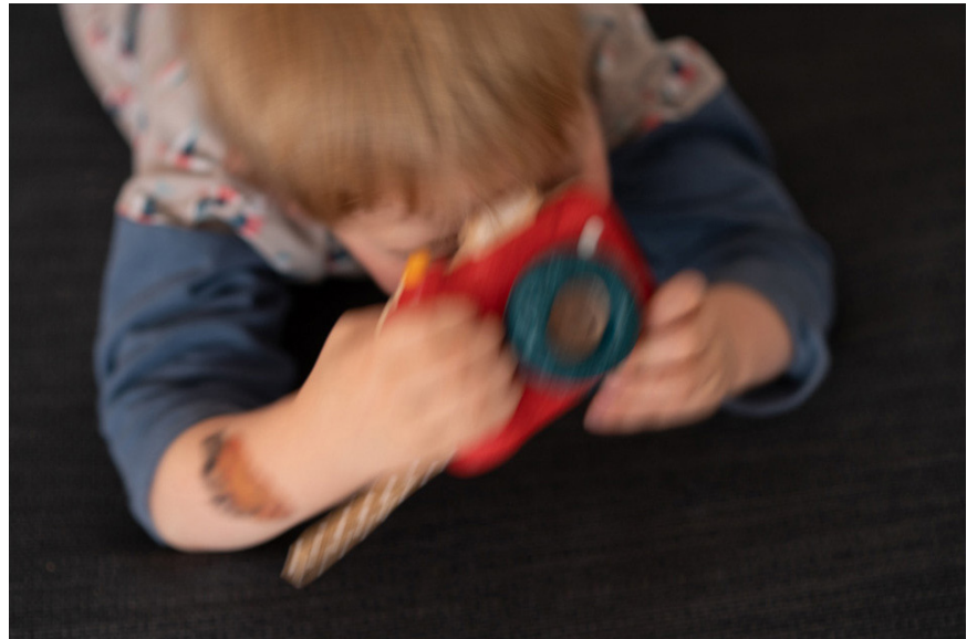
Platz 5: Walter SCHWAB