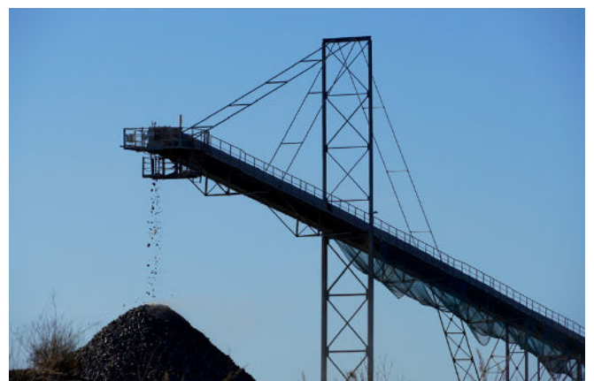
Platz 4: Winfried WYNOHRADNYK

Die beiden Bilder auf Platz 5: → Seite 3