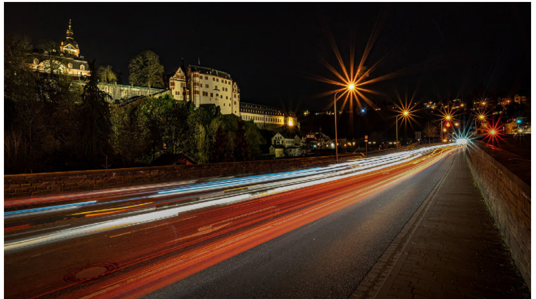
Platz 1: Wolfgang SCHWALB

Wolfgang Schwalb hat mit dem erhabenen Schlosskomplex links oben und der tristen Mauer rechts unten einen Teil des nächtlichen Lebens in Weilburg kanalisiert. Unter Sternenlicht, wie es sich gehört, auch wenn er dafür die Laternen »missbrauchen« musste. Er hat 30 Sekunden Verkehrsgeschehen mit 14 mm eingefangen und bei Blende 16 auf den Sensor wirken lassen und so ein Bild erzeugt, das das normale Auge live nie sehen kann. Herzlichen Glückwunsch an Wolfgang zum Gewinnerbild des BdM im März.