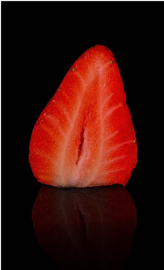
Platz 5: Wolfgang SCHWALB